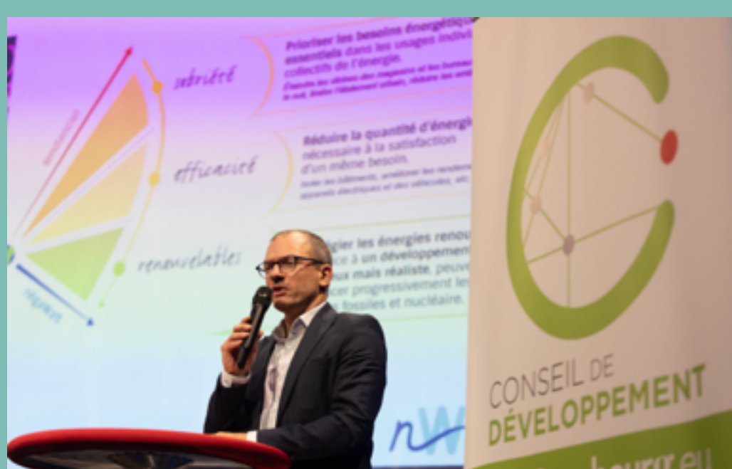
Voir l'extrait de son intervention en cliquant sur l'image.

Interrogé sur les actions à portée des ménages pour entamer des démarches de sobriété énergétique, Emmanuel Rivière, directeur de l'Agence du Climat, a rappelé les dispositifs d'aide existants. En matière de rénovation thermique ou d'accès à la mobilité décarbonée, l'Agence du Climat accompagne les ménages dans ces changements. L'idée est de « maximiser les aides pour diminuer absolument le reste à charge ». Ce reste à charge est à mettre en perspective, selon lui, avec les économies qui seront réalisées dans le futur et les nouvelles contraintes qui vont s'imposer aux propriétaires qui louent leur bien. Comme le souligne Emmanuel Rivière, « la loi Climat et Résilience de 2021 va progressivement interdire la location de biens avec une étiquette G. » Ces aides doivent donc être connues par le plus grand nombre.