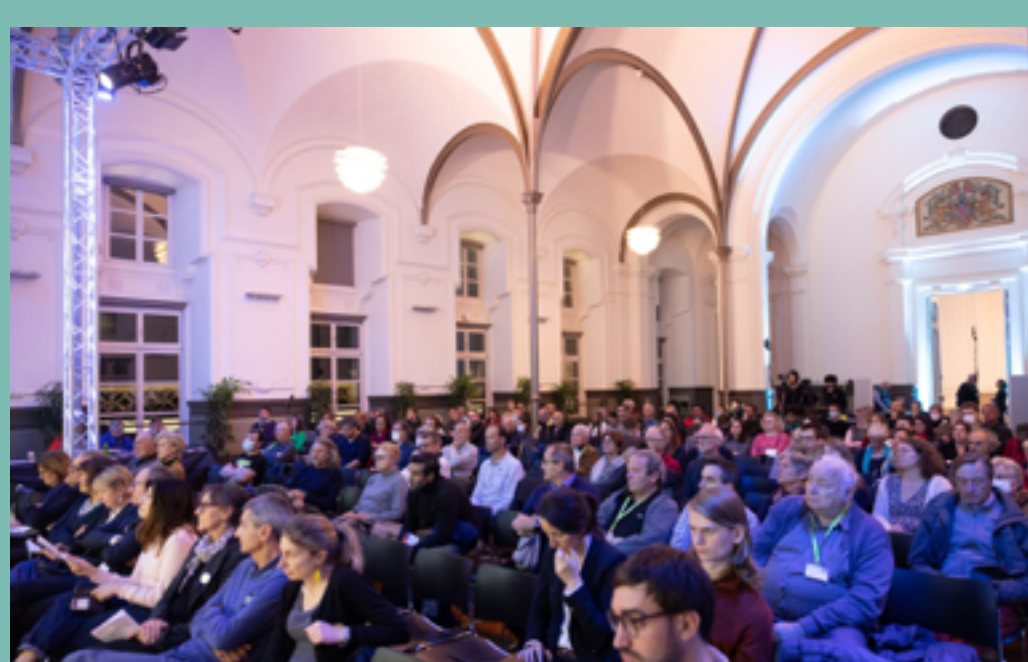
Voir l'extrait de son intervention en cliquant sur l'image.